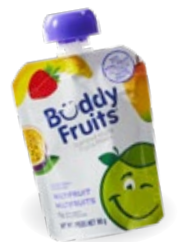
Compote de fruits***

🌿 SANS VIANDE 🍷 ALLERGIES : NOTRE MENU ÉVOLUE CONSTAMMENT. N'HÉSITEZ PAS À CONSULTER NOTRE GUIDE DES ALLERGÈNES OU À VOUS INFORMER AUPRÈS DE NOTRE PERSONNEL.